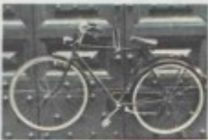
Una bici assicurata a un portone

O BLIGARE i condomìni a creare aree ad hoc all'interno degli edifici da destinare a parcheggio delle biciclette. Pena? Multe salacissime che potrebbero arrivare anche a 500 euro. È quanto prevede la proposta di modifica al regolamento edilizio di Roma emanata dai consiglieri M5S Enrico Stefano, presidente della commissione Mobilità, Paolo Ferrara e Daniela Iorio. «In vista di un più generale programma di riassetto del trasporto pubblico e privato nel territorio di Roma Capitale — si legge nella proposta di delibera consiliare — è indispensabile attuare ed avviare, nel più breve tempo possibile, politiche di sviluppo e incentivazione dell'uso della bicicletta come mezzo di mobilità sostenibile». Con 15 Stelle vogliono riformare il Regolamento Edilizio e introdurre ilobbligo di destinare, all'interno dei cortili dei condomìni, sia negli edifici esistenti che nelle nuove edificazioni, appositi spazi da destinare al parcheggio esclusivo di biciclette.